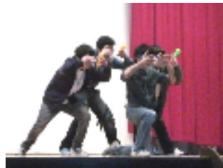
2 年男子によるダンス