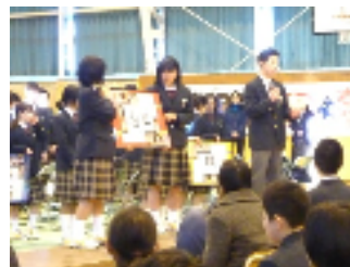
3 年 1 組「白黒(しんじつ)」