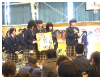
3 年 3 組「轍(わだち)」