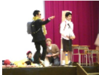
1 年生による小芝居

これまで様々な行事や部活動、そして生徒会活動などで大きな存在感を示し、塩一中をリードしてきた 3 年生 114 名が、自分の夢に向かってそれぞれの道を一步一步力強く、そして着実に歩み続けていくことを願っています。卒業生に幸あれ！