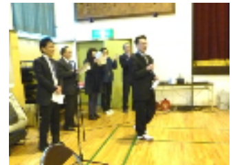
職員からのプレゼント