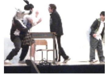
2 年生による小芝居