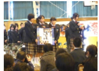
3 年 2 組「凜(りん)」