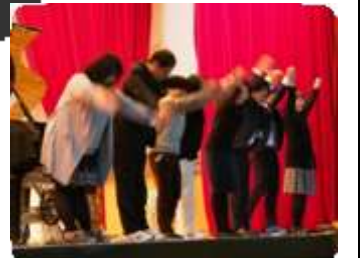
↑3学年スタッフ On stage