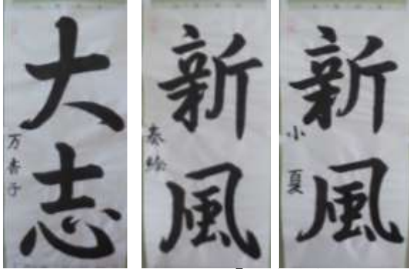
※県展表彰作品「金賞受賞」