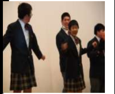
↑3年生のこの表情! 後輩達からのメッセージを一身に受け取り、心の底から楽しんでくれました。