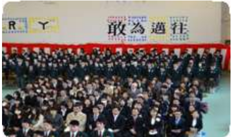
↑ さらば先輩、仰げば尊し♪