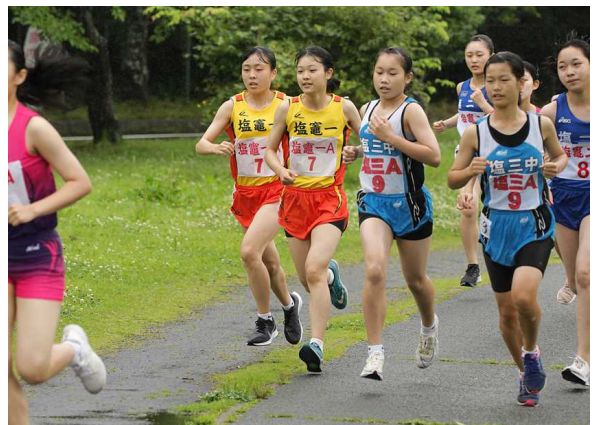
あともう少し頑張ろうと思えました。

私たち女子駅伝部は団体3位という結果でした。目標である優勝はできませんでしたが、区間賞を3つ取ることができました。みんな朝練習や放課後の練習を大会当日まで一生懸命頑張ってきました。普段は皆違う部活ですが、日を重ねるごとに仲良くなり、大会当日はチームが心を一つにして大会に挑めたと思います。大会当日は大雨で日程が変わりましたが、一人一人が練習をした成果を発揮できたと思います。緊張している仲間や走っている仲間に励ましの声や応援の声掛けをしていました。走っているときのその応援の声が力となり、あともう少し頑張ろうと思えました。駅伝に向けての朝や放課後の練習で、駅伝練習に取り組む前よりも体力がついたと思います。今回は優勝できなかったのですが、来年は優勝できるように頑張りたいです。