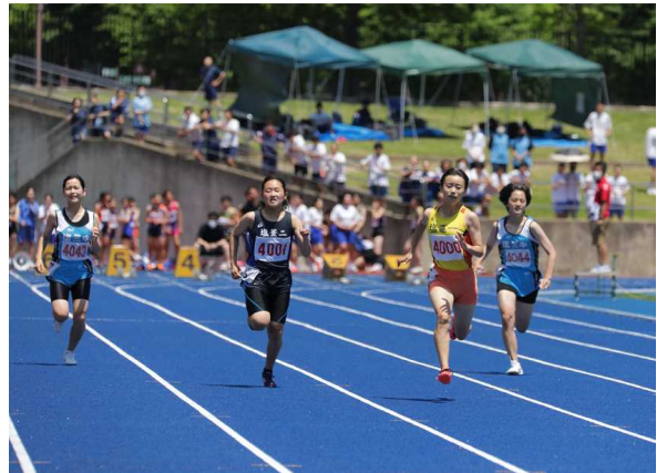
部員全員が悔いのないレースができるようにしたいです。県大会も応援をよろしくお願いします。

しかし、陸上部としての改善点は今回の市中総体を通していくつか見えてきました。部活動内の雰囲気づくりや行動の遅さ、そして大会や競技に対する真剣さが足りないことです。県大会の目標は、①出場者全員が入賞すること、②3年生全員が東北大会出場を果たすことです。残り少ない練習を大切にして、部員全員が悔いのないレースができるようにしたいです。県大会も応援をよろしくお願いします。